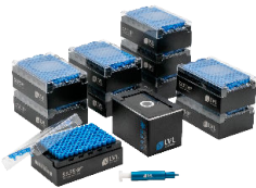
Starter Pack Small

Die SAFE® Starter Packs sind ideal für Labore, die ihre Probenlagerung optimieren und gleichzeitig die Kosten im Blick behalten möchten. Mit den enthaltenen SBS Racks können Sie Ihre Proben effizient und platzsparend organisieren. Unsere Röhren sind für extrem niedrige Temperaturen bis zu -196^{\circ}\text{C} (LN 2 ) geeignet und bieten höchste Sicherheit und Identifizierbarkeit Ihrer Proben.