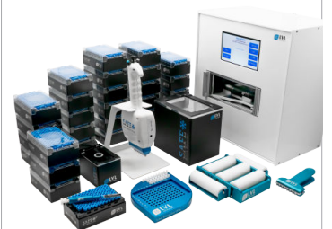
Starter Pack Complete