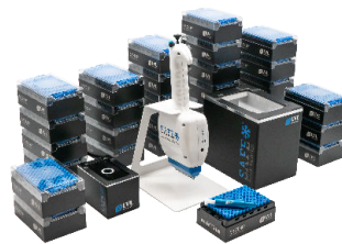
Starter Pack Large