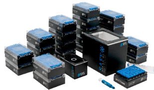
Starter Pack Medium